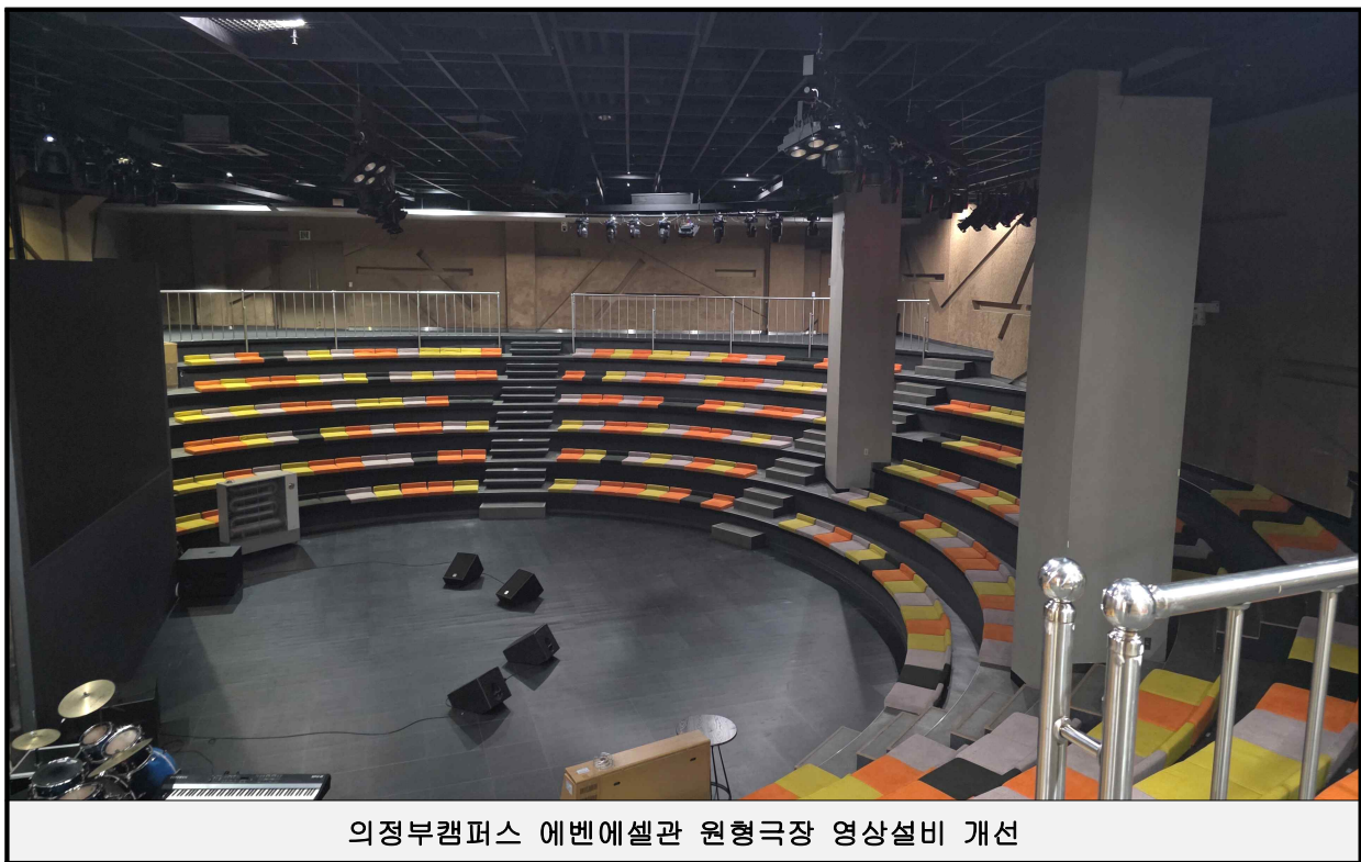
의정부캠퍼스 에벤에셀관 원형극장 영상설비 개선